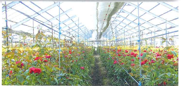
水膜有り(フィルム内面濡れ); 水膜無し(フィルム内面乾燥)

④ ハウス内で作業される方を紫外光線から守り、各種資材の劣化損傷もやわらげます。